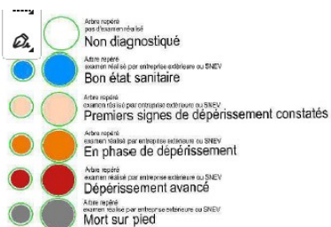
Figure 17 : Légende du diagnostic actualisé des arbres d'alignement de l'Avenue Bollée